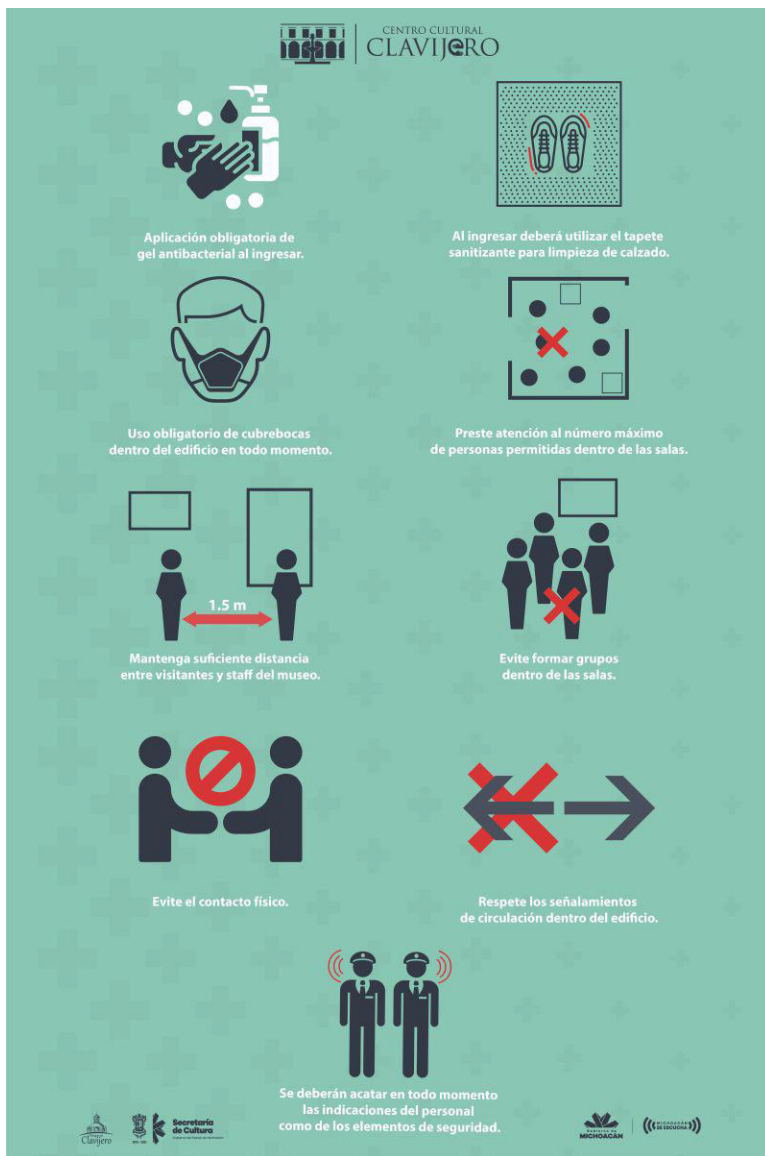
Figura 3. Protocolo de ingreso en el Centro Cultural Clavijero. Recuperado de https://ccclavijero.mx/protocolos-de-acceso/ (última consulta: 03/06/2021).