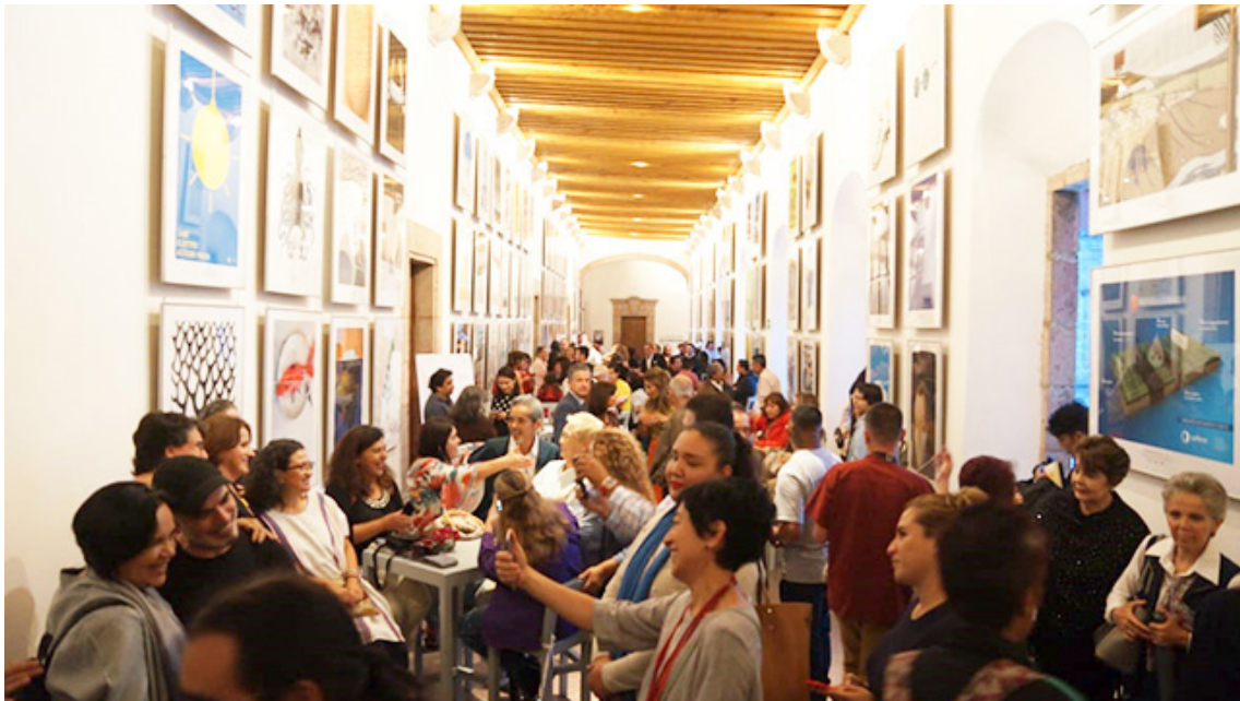
Figura 2. Inauguración de "Mi Michoacán", 2019. Recuperado de: http://www.mimichoacan.mx/municipio/centro/clavijero-el-centro-cultural-mas-visitado-en-michoacan/ (última consulta: 03/06/2021).

Los visitantes deben ahora mantener una distancia de 1.5 metros entre cada persona. También es necesario portar en todo momento el cubrebocas y en la entrada del CCC se encontrará siempre un personal de seguridad privada que tomará la temperatura y pondrá gel antibacterial a cada uno de los visitantes. Además, se estableció que, al momento de iniciar la visita, se debe avanzar hacia la derecha, evitando de esta forma que las personas se encuentren.