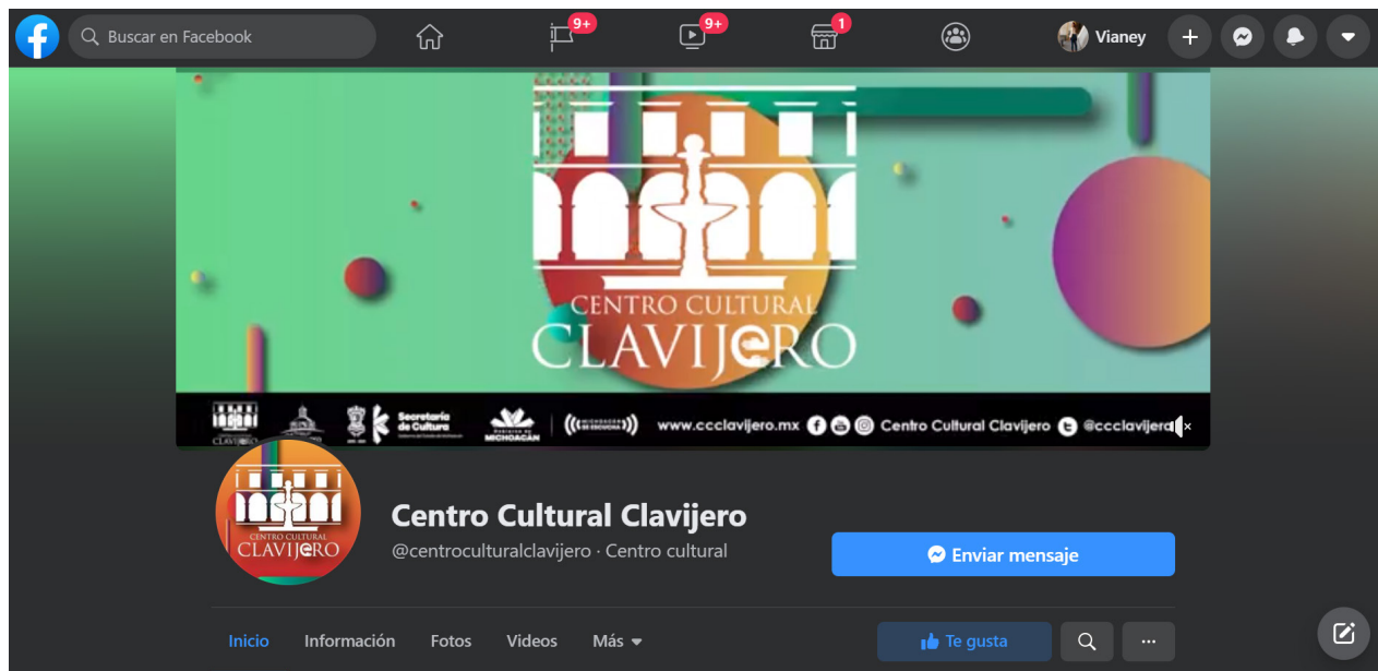
Figura 4. Página oficial del Centro Cultural Clavijero, Vianey Lara, 2020. https://web.facebook.com/centroculturalclavijero (última consulta: 03/06/2021).